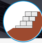
Estructuras de gravedad livianas