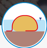
Coraza para protección de estructuras de control hidráulico

Tiene capacidad biaxial y es articulable siendo rígido. Está diseñado para ser utilizado como estructura para paso de vehículos en vías de acceso sobre suelos blandos y para la protección de estructuras de control hidráulico conformadas con tubos geotextil y otras vulnerables a impactos y abrasión.