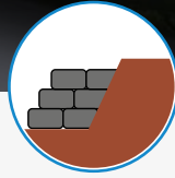
Estructuras de gravedad

Está compuesta por dos capas de geotextil a manera de funda tubular sin costuras laterales y está dotada de una válvula de cierre que obtura la abertura de llenado al retirar la tubería. BAG PP presenta alta resistencia de sus fibras y costuras lo que le permite un adecuado desempeño bajo las presiones de llenado. Es empleado en revestimientos y protección de orillas y taludes de ríos, lagunas y líneas costeras, revestimiento de soleras y aproximaciones a canales, puentes, alcantarillas, box culvert, conformación de diques, espigones y estructuras bajo agua.