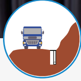
Subdrenaje en vías

Tiene sección circular y está dotada de orificios en su perímetro para captar el exceso de agua libre en el suelo. Presenta alta resistencia a la compresión y al impacto, alta área abierta (perforaciones), es resistente al ataque de productos químicos y tiene facilidad de curvatura que facilita el transporte y la instalación de suelos y capas granulares.